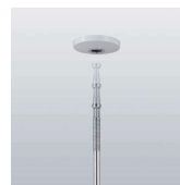
吊下げポール 1本の耐荷重目安 8kg

吊下げポールが簡単に脱着できる天井付けの物干し金物と1.7mまで伸縮する竿が2セット。床はクッションフロア仕上げ。洗濯機置き場を設置。